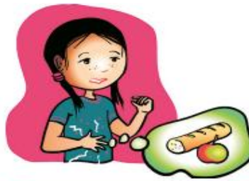
Faim (mal au ventre)