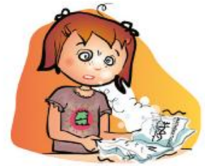
Vision floue ou double