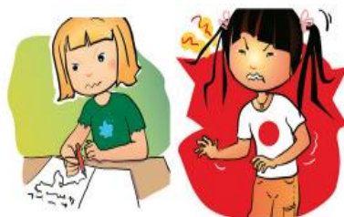
Comportement bizarre, irritabilité, nervosité