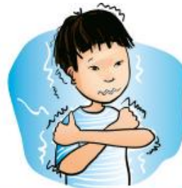
Sensation de froid, picotement des lèvres