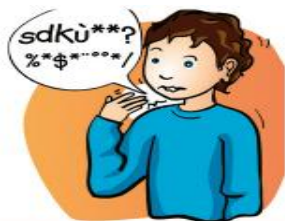
Troubles de la parole